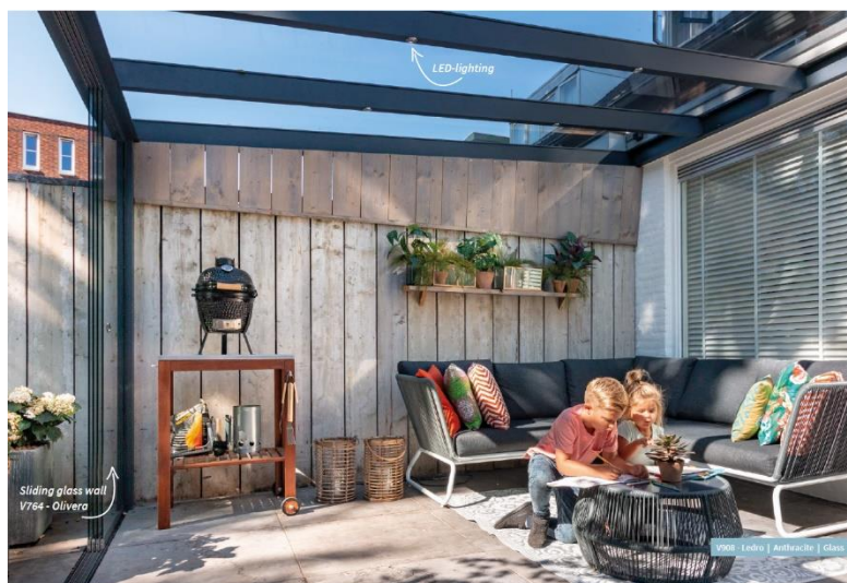
Kombiner Ledro med glasdøre, LED lys og markise

Standard stelfarver: Hvid eller antracitgrå. Andre farver mod tillæg.